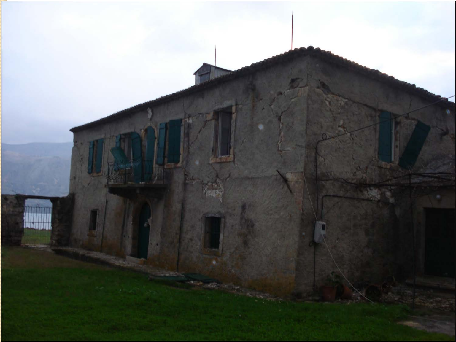
Κτίριο Τυπάλδου-Φορέστη στο Σαμόλι στο Λιβάδι