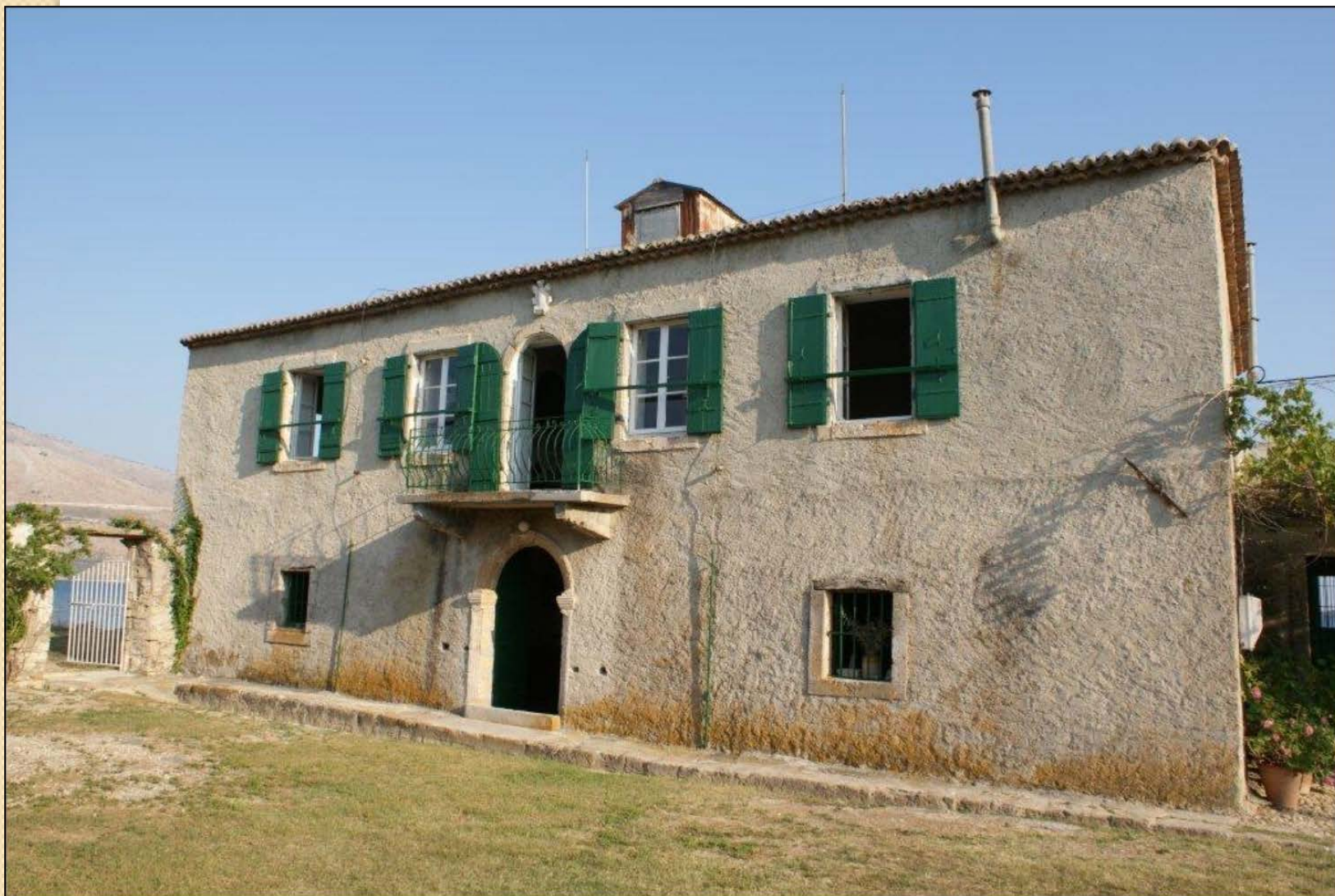
Κτίριο Τυπάλδου-Φορέστη στο Σαμόλι στο Λιβάδι