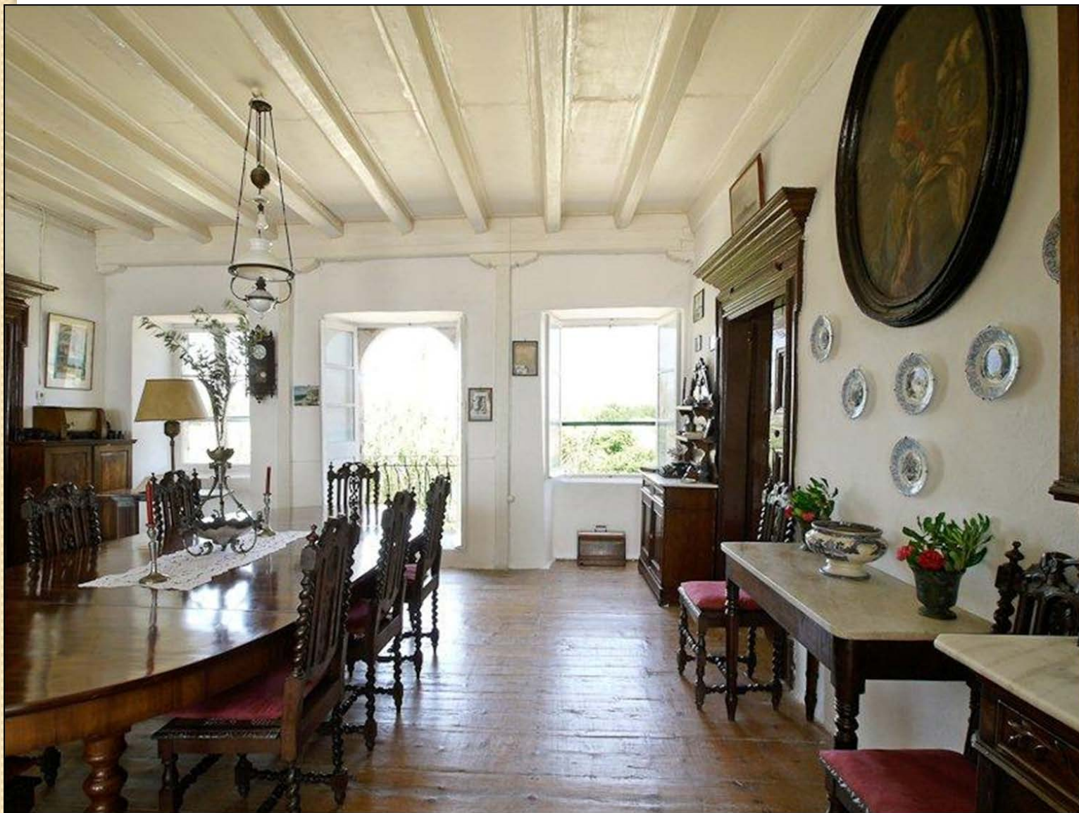
Κτίριο Τυπάλδου-Φορέστη στο Σαμόλι στο Λιβάδι