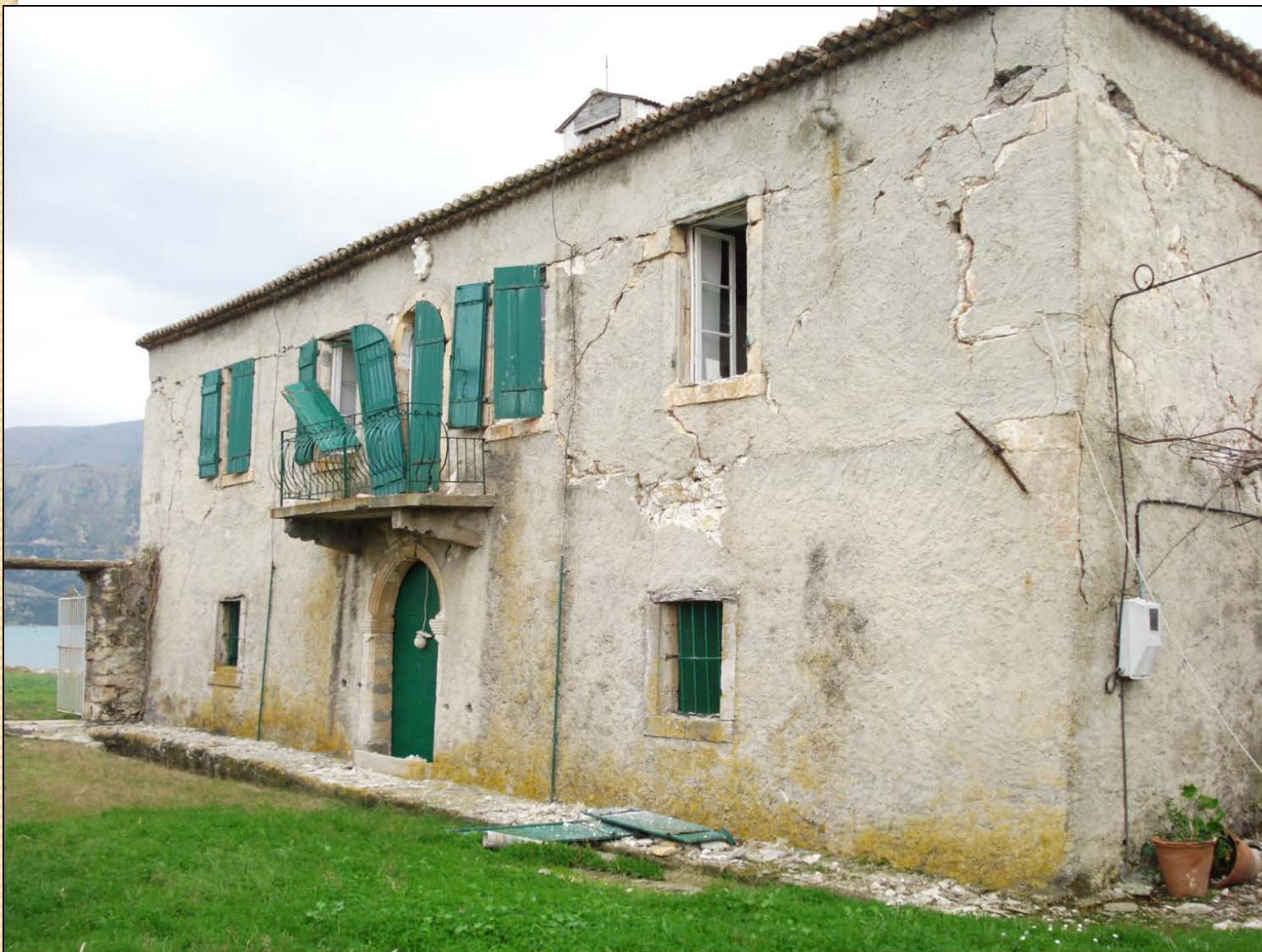
Κτίριο Τυπάλδου-Φορέστη στο Σαμόλι στο Λιβάδι