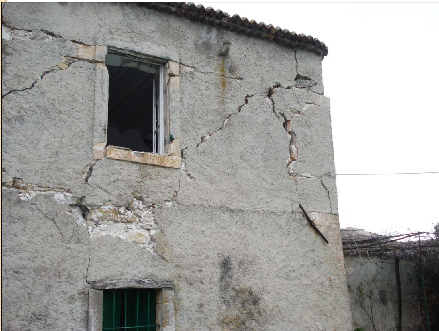
Κτίριο Τυπάλδου-Φορέστη στο Σαμόλι στο Λιβιάδι