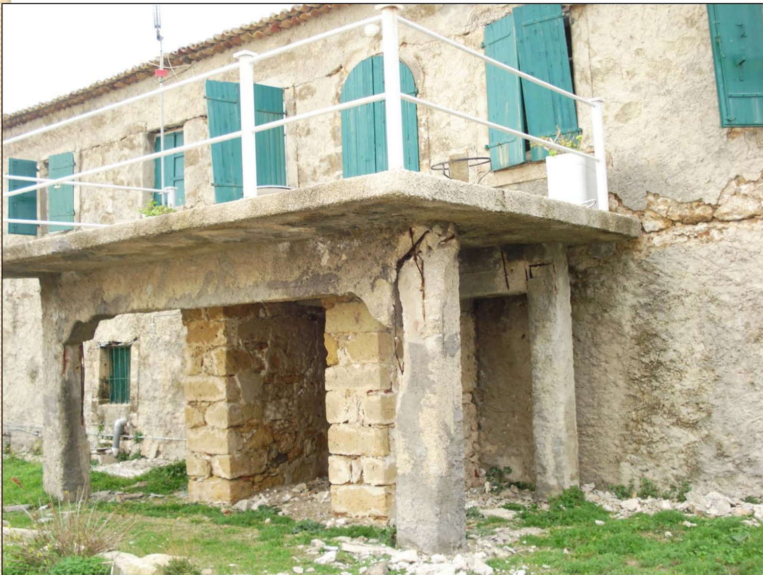
Κτίριο Τυπάλδου-Φορέστη στο Σαμόλι στο Λιβάδι