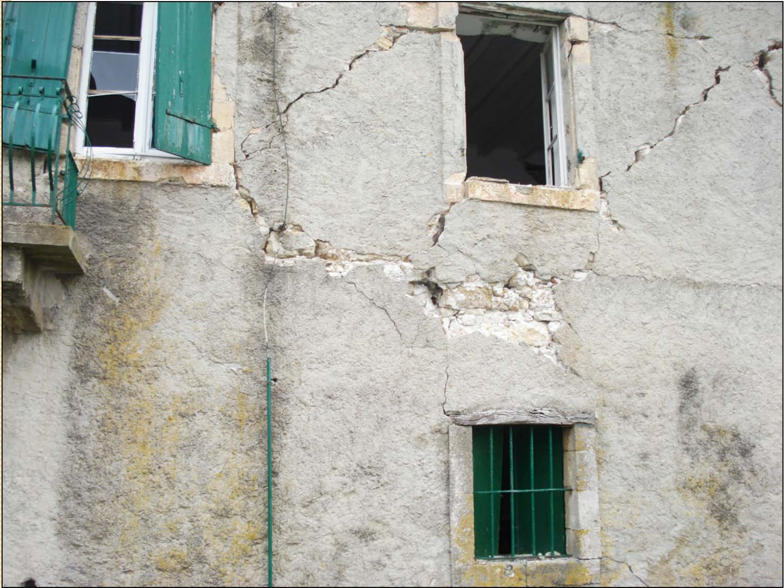
Κτίριο Τυπάλδου-Φορέστη στο Σαμόλι στο Λιβάδι