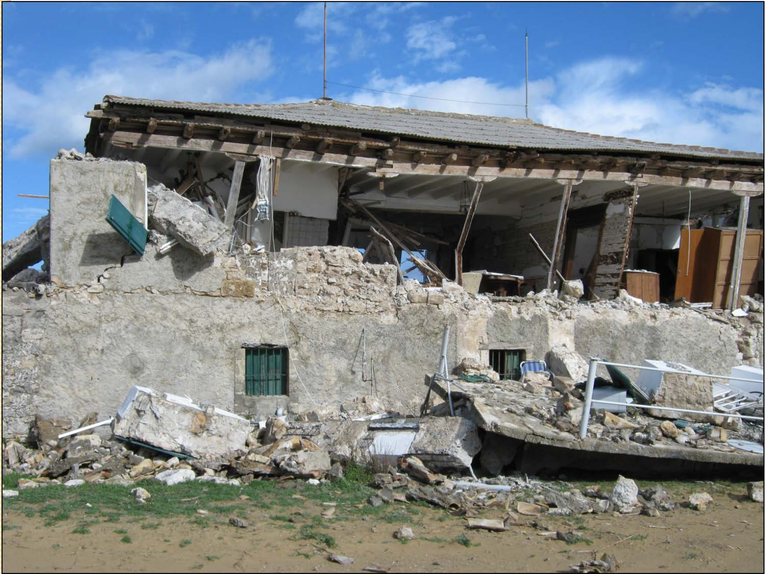
Κτίριο Τυπάδου-Φορέστη στο Σαμόλι στο Λιβάδι