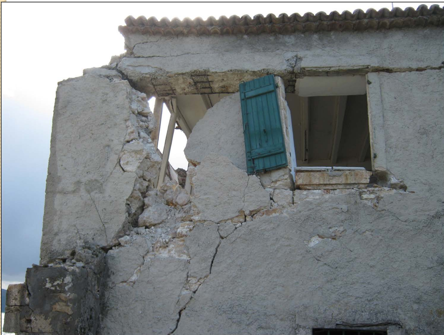
Κτίριο Τυπάλδου-Φορέστη στο Σαμόλι στο Λιβάδι