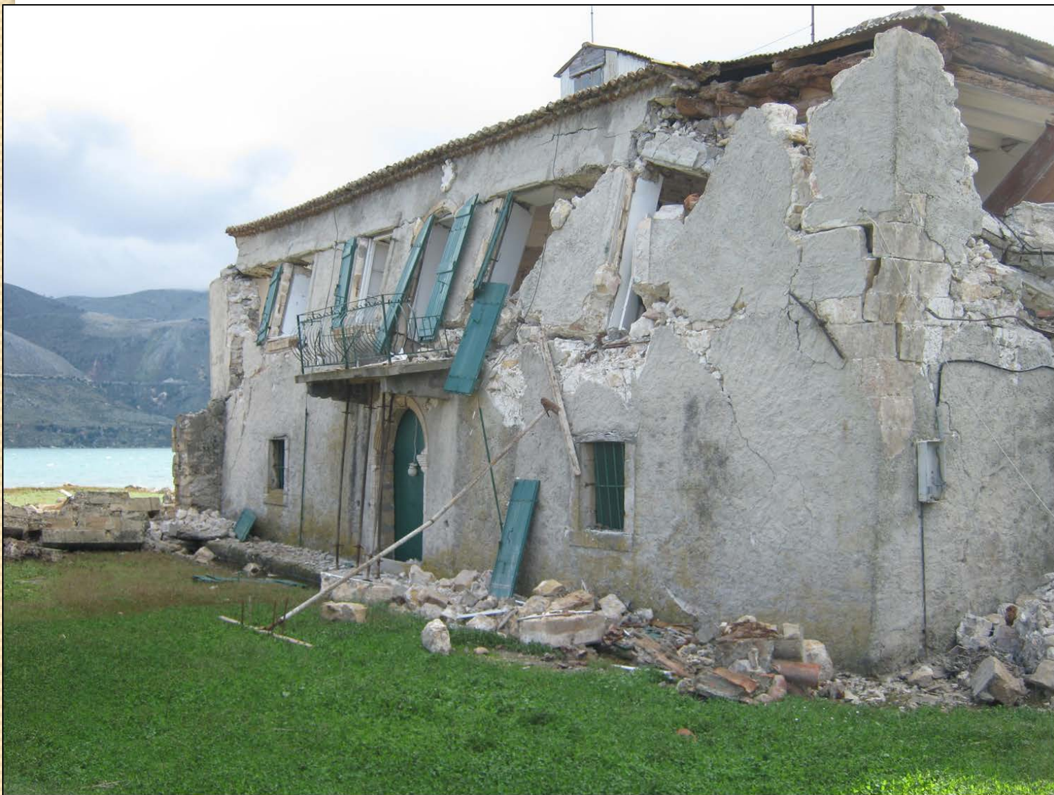
Κτίριο Τυπάλδου-Φορέστη στο Σαμόλι στο Λιβάδι