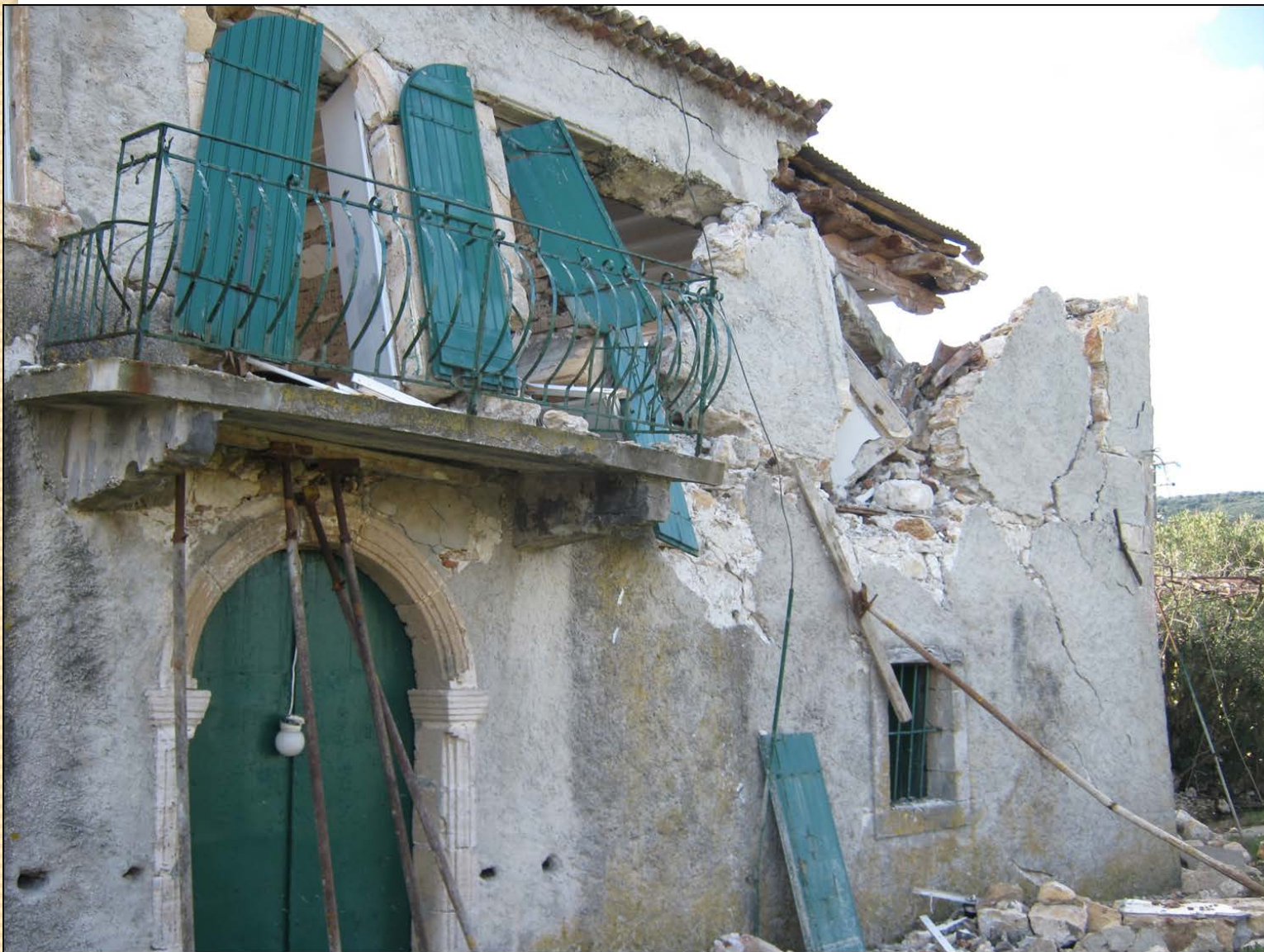
Κτίριο Τυπάλδου-Φορέστη στο Σαμόλι στο Λιβάδι